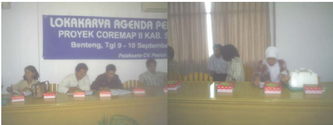
Gambar 7. Peserta asyik mengikuti kegiatan diskusi