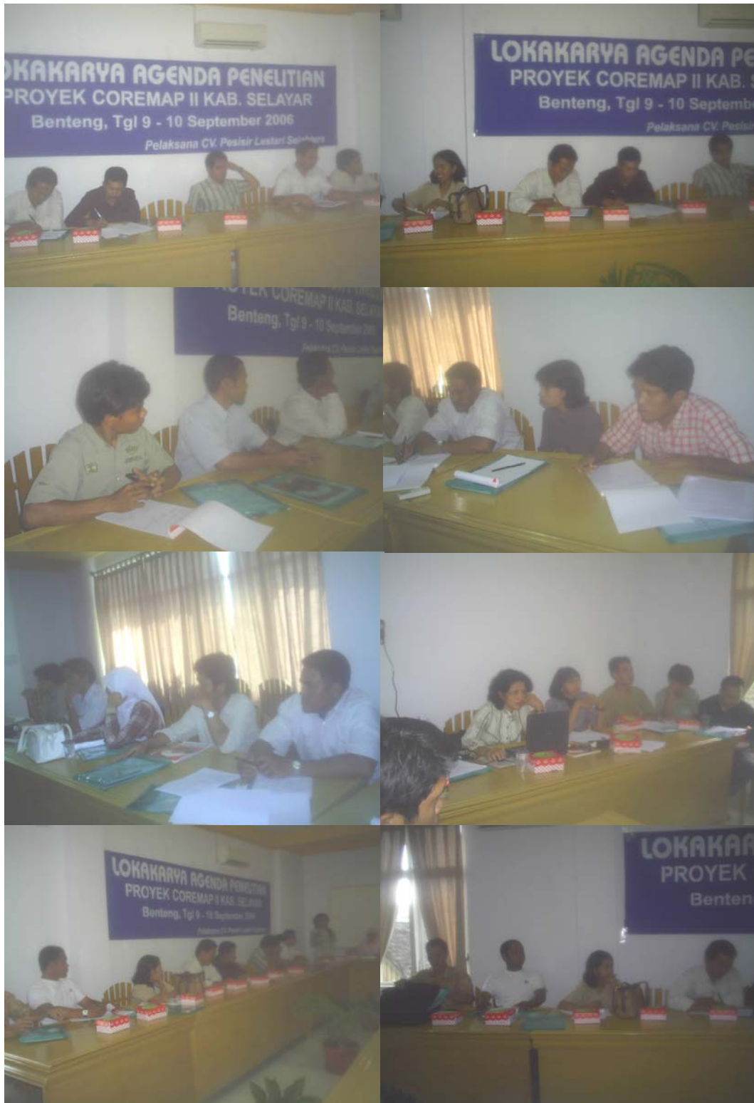
Gambar 1. Peserta lokakarya agenda penelitian pada berbagai momen