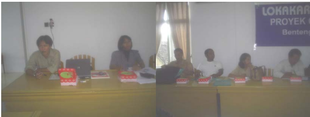
Gambar 8. Koordinator CRITC sedang asyik memantau pelaksanaan lokakarya